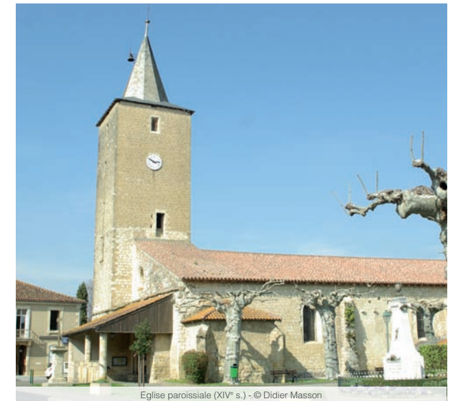
Eglise paroissiale (XIV e s.)