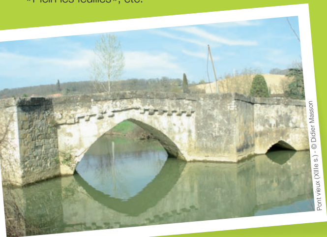
Pont Vieux (XIII e s.)

Retrouvez à Pavie des animations variées tout au long de l'année : fête des crêpes, foire au jardinage, Trad'Envie, festival « Plein les feuilles », etc.